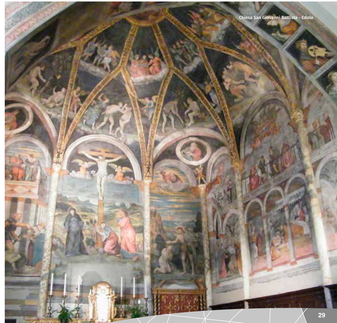
Chiesa San Giovanni Battista - Edolo

http://turismoweb.provincia.brescia.it/strutture/