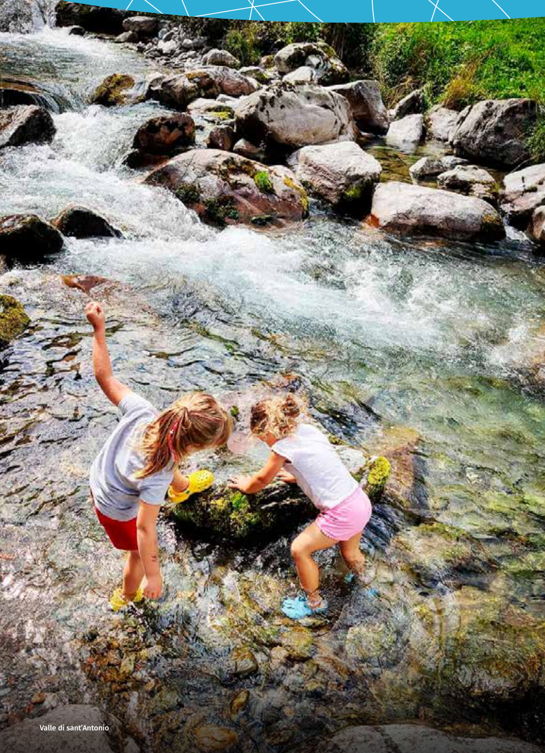
Valle di sant'Antonio