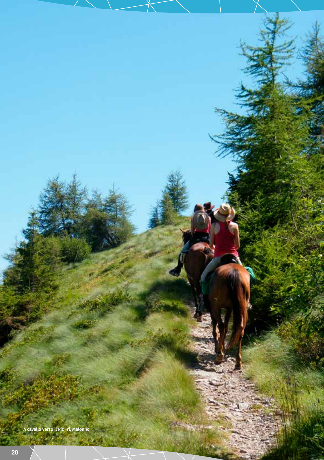
A cavallo verso il Piz Tri, Malonno