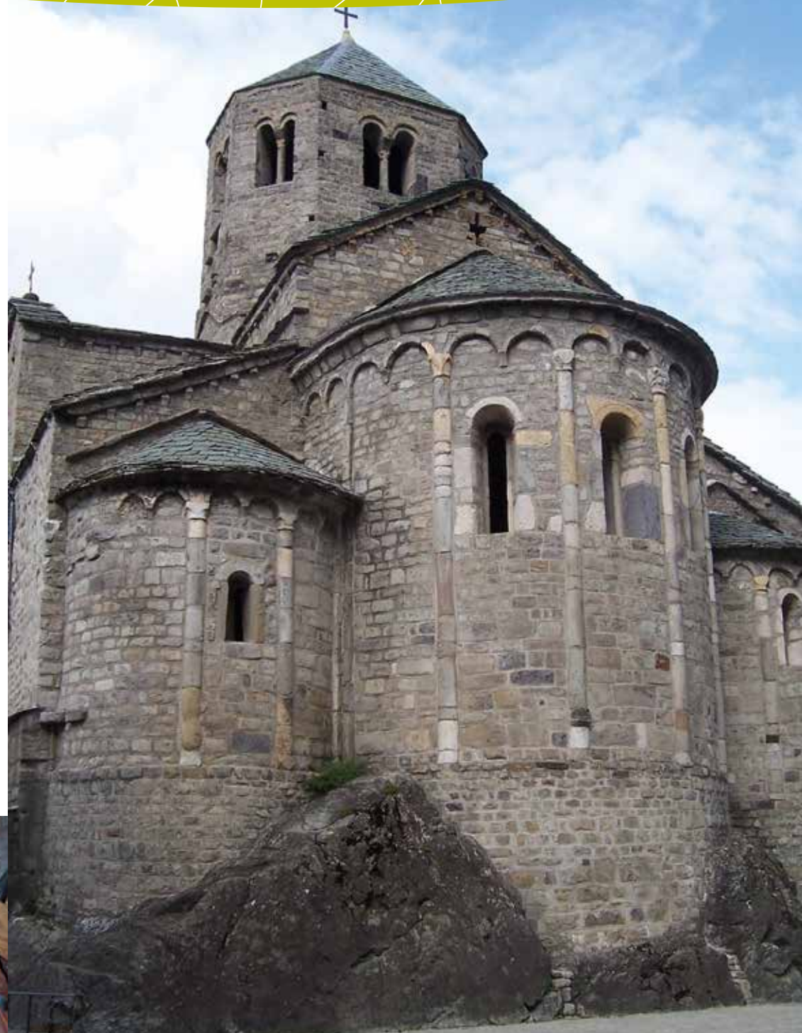
Monastero di S. Salvatore a Capo di Ponte

RISTORANTE PIZZERIA GRAMULI 0364 434013 Via Ronchi, 20a www.gramuli.it ristorante@gramuli.it ☎ Ristorante Gramuli