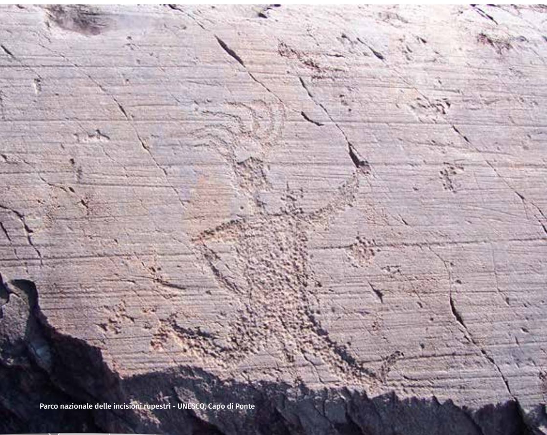
Parco nazionale delle incisioni rupestri - UNESCO, Capo di Ponte

ELIMAST 0364 598881 Via segheria (Temù - SEDE DISTACCATA) Via Bontempi, 16 (Darfo B.T. - SEDE OPERATIVA) www.elimast.it info@elimast.it 📍 Elimast helicopter service