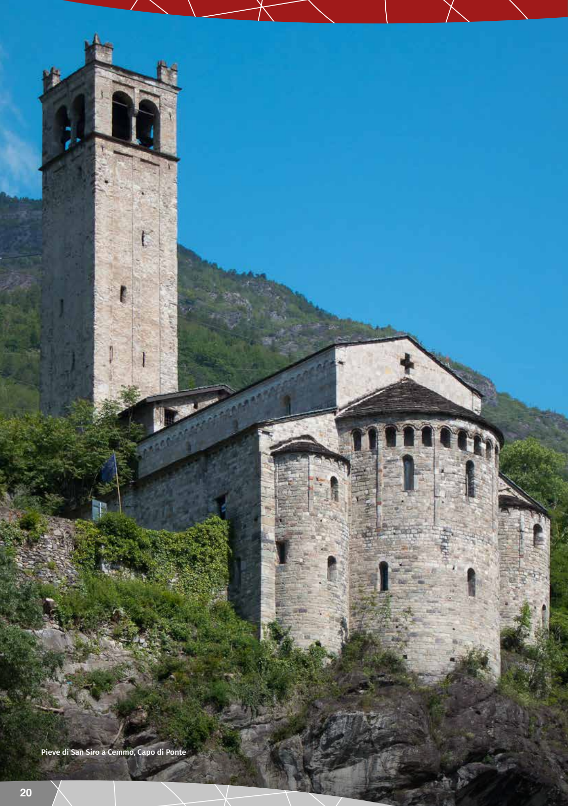
Pieve di San Siro a Cemmo, Capo di Ponte