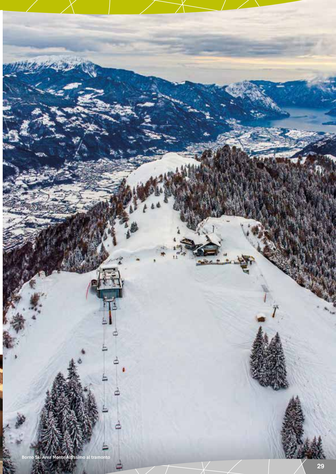
Borno Ski Area Monte Altissimo al tramonto