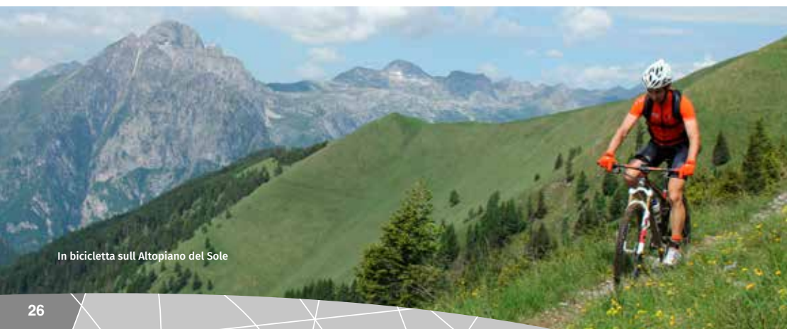
In bicicletta sull'Altopiano del Sole