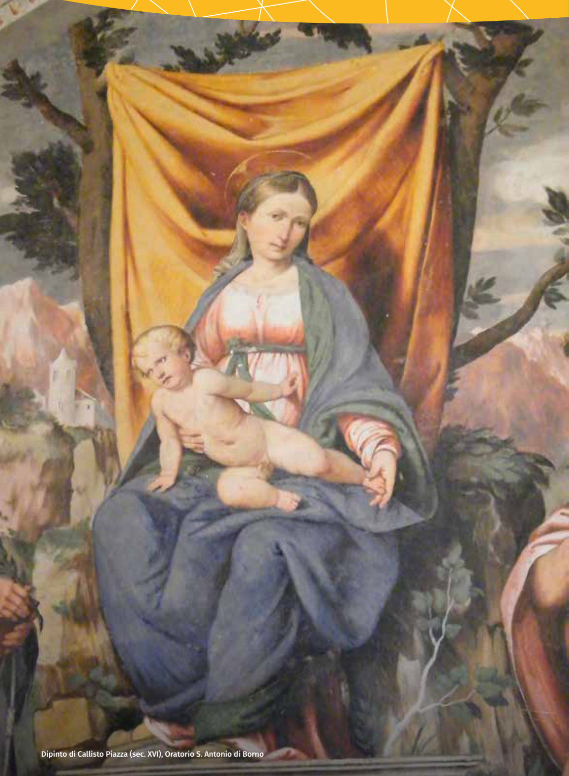
Dipinto di Callisto Piazza (sec. XVI), Oratorio S. Antonio di Borno