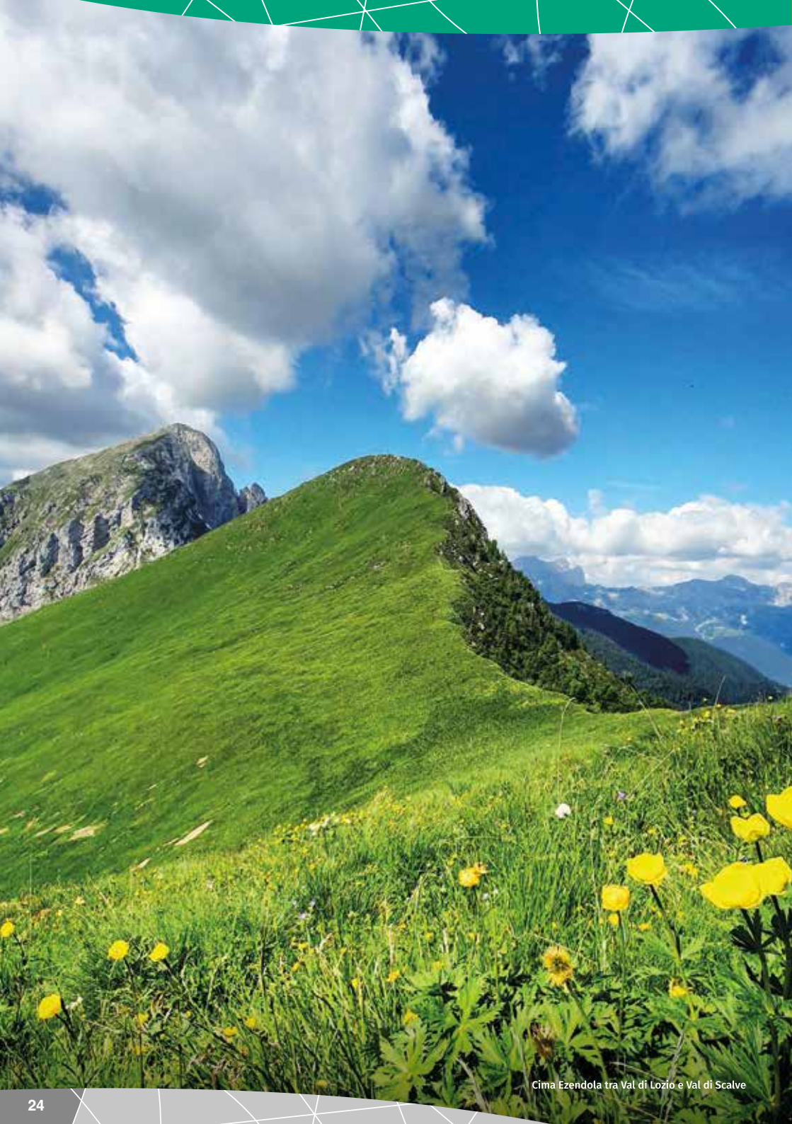
Cima Ezendola tra Val di Lozio e Val di Scalve