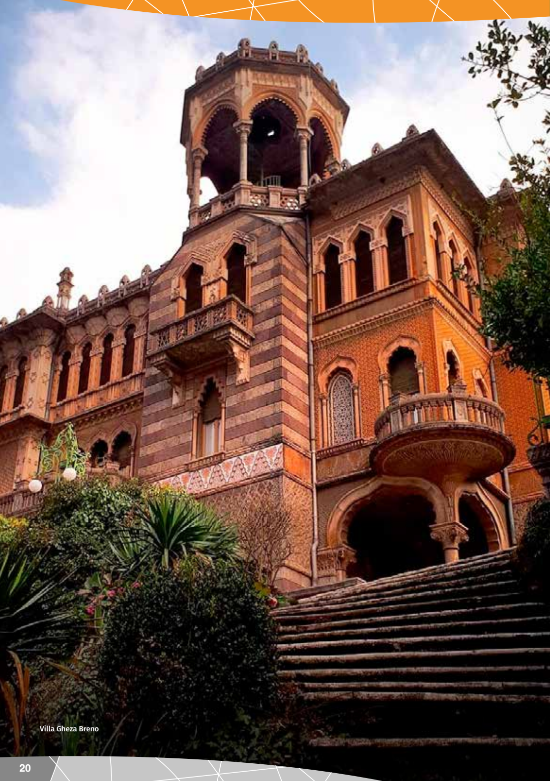
Villa Gheza Breno