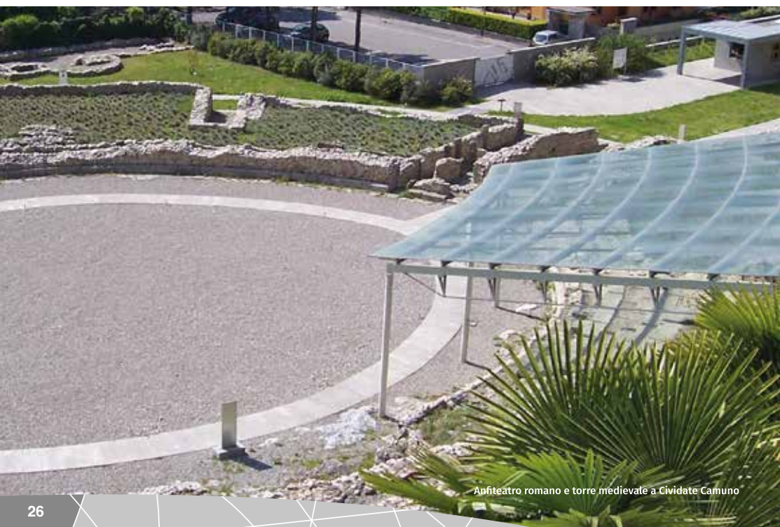
Anfiteatro romano e torre medievale a Civitate Camuno

TOTALBAR S.N.C. 0364 339119 SS 42 del Tonale e della Mendola