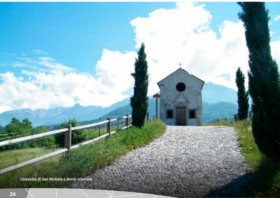
Chiesetta di San Michele a Berzo Inferiore

http://turismoweb.provincia.brescia.it/strutture/