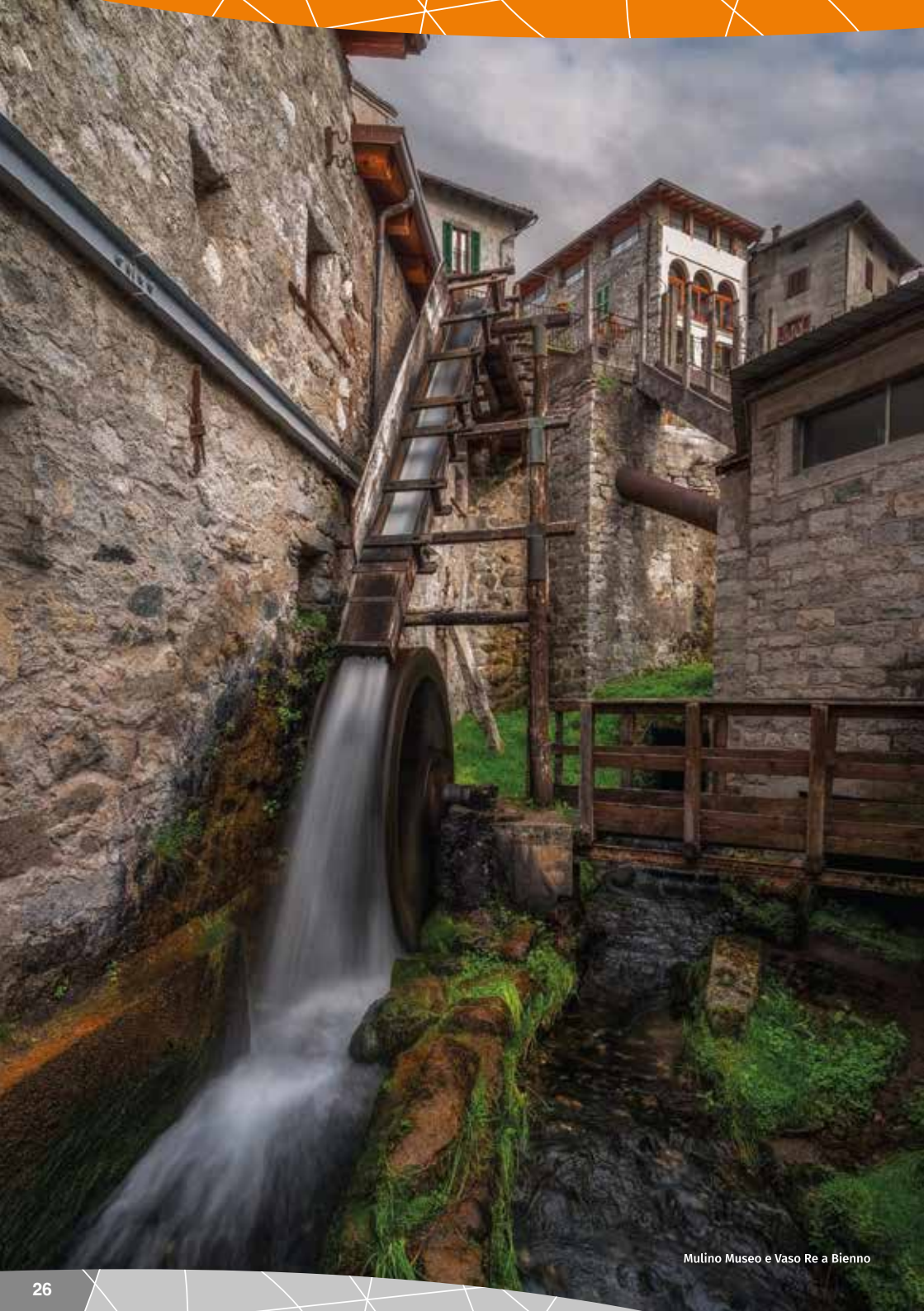
Mulino Museo e Vaso Re a Bienno