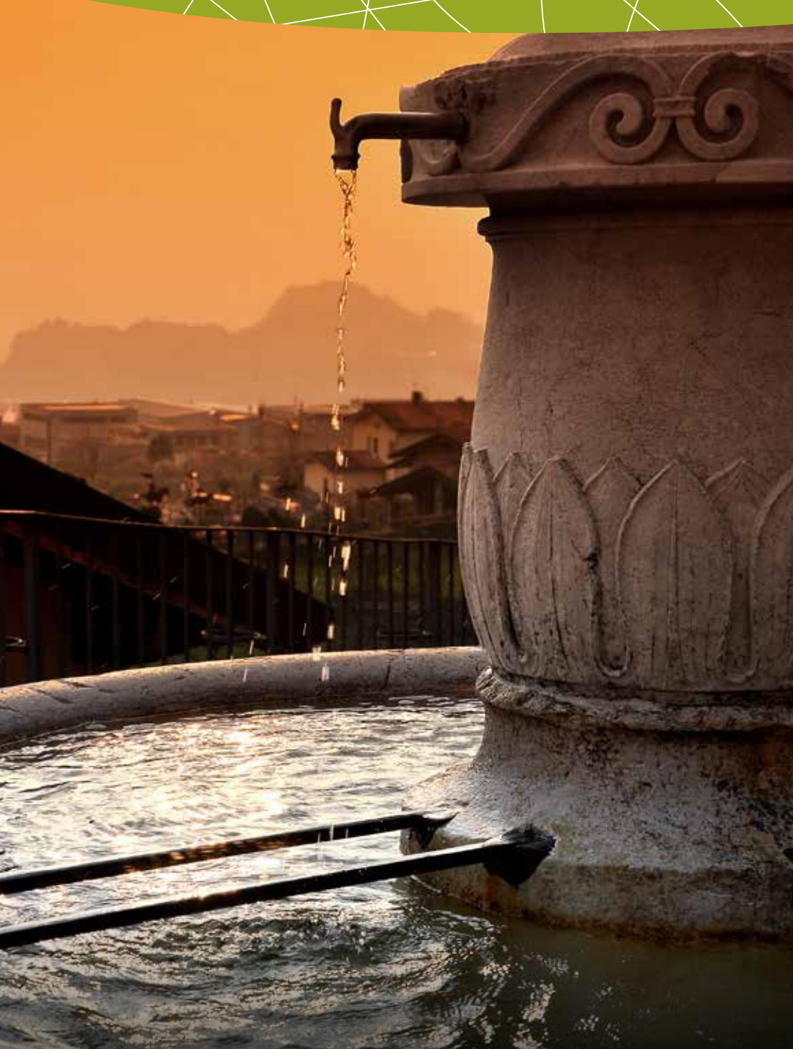
Fontana di piazza Roma a Bienno